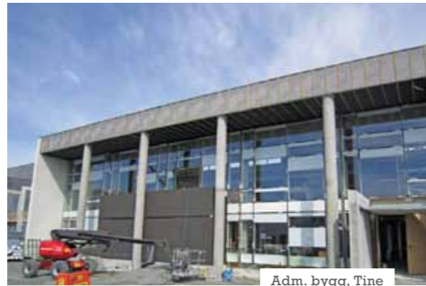
Adm. bygg, Tine

Så var det min tur til å gi et bidrag til Jærentreprenør Nytt. For de som ikke kjenner meg er jeg 30 år, gift, tre unger og bosatt i Sirevåg. Hobbyen er Tottenham og Brusand 2. Jeg begynte som anleggsleder her for tre år siden, før jeg ble prosjektleder i mars i år. Det er en spennende og utfordrende jobb, men med så mye hyggelige kollegaer både ute og inne er det veldig gildt. Jeg har ellers meldt meg på en sykkeltur som vel er ferdig når dette leses, uten at en trenger si så mye mer om det.