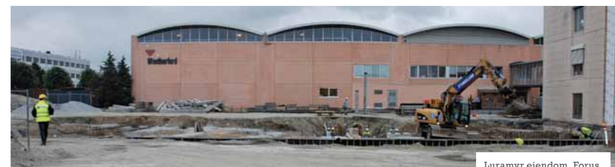
Luramy eiendom, Forus