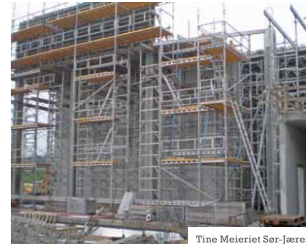
Tine Meieriet Sør-Jæren